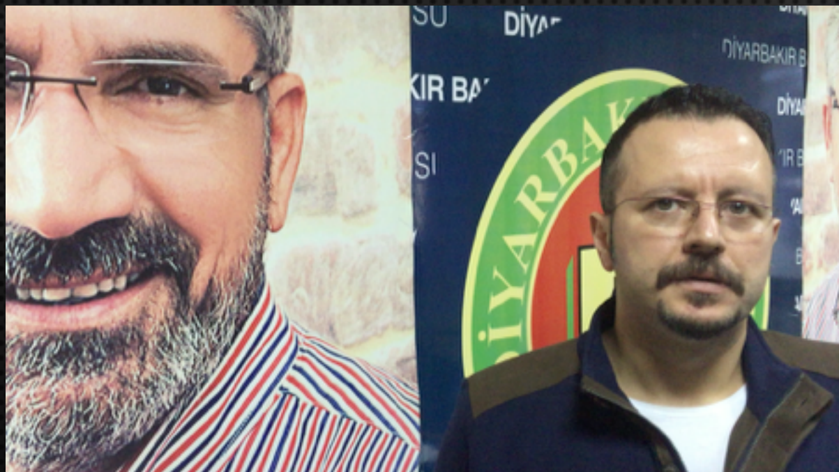
"Endangered Lawyer" Project, UCPI, Italy